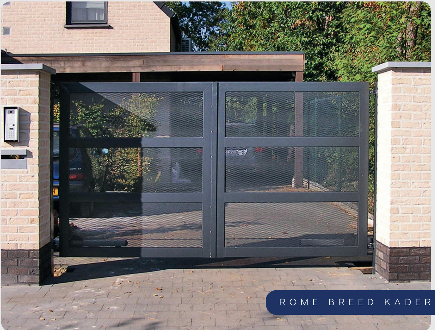
ROME BREED KADER